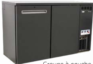
Groupe à gauche

SFK-6E+ 93016 Refroidisseur de fûts 1 porte + 1 petite porte Capacité de stockage : 6x20L ou 2x20L+1x50L Dimensions L x P x H : 111 x58 x 84/86 cm SFK-6EL+ 93017 Groupe à gauche